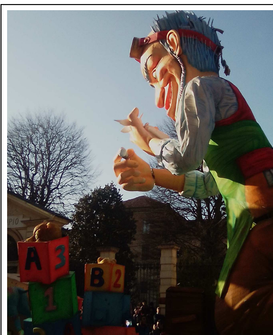
Un satirico Geppetto tiene in mano un piccolo Pinocchio. Uno dei carri più imponenti ed apprezzati dal pubblico.

Lanci di coriandoli dai carri verso i bambini festanti, cittadini poco mascherati ma comunque attivi nell'osservare la sfilata e pronti ad un selfie per ricordare l'evento. La maestosità di qualche carro ha portato i nasi all'insù per ammirare i profili delle sagome colorate e le mani in alto per riuscire a catturarne qualche fotogramma. Una giornata tutto sommato un po' diversa dalla solita routine invernale che ha consentito di sgranchiare un po' le gambe ed abbozzare qualche sorriso alla vista delle maschere più grottesche.