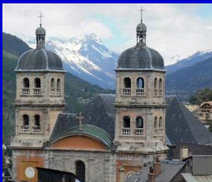
Veduta di Briancon