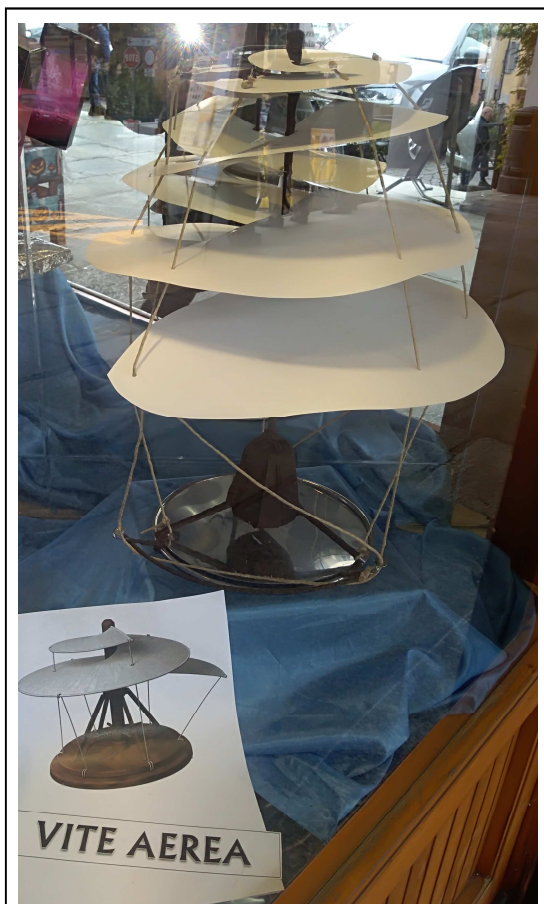
Vetrina che espone la riproduzione della famosa "vite aerea" leonardesca.

Nella seconda vetrina abbiamo ritrovato la "vite aerea", un progetto ideato da Leonardo da Vinci e descritto nel foglio 83v del Manoscritto B, redatto durante il suo primo soggiorno milanese. In questo studio di vite aerea, Leonardo arriva a ipotizzare e formulare in anticipo di secoli l'efficacia trattiva dell'elica, concependo una struttura molto simile, ispirandosi alle forme della natura e dando corpo alle sue osservazioni sulle caratteristiche dell'aria. Nelle intenzioni dell'inventore, avrebbe dovuto "avvitarsi" nell'aria sfruttandone la densità similmente a quanto fa una vite che penetra nel legno. Non vi è prova che Leonardo abbia effettivamente costruito la macchina da lui immaginata che rimarrebbe, quindi, una delle tante intuizioni teoriche della multiforme attività del celebre inventore. Per molti anni è stata erroneamente presentata al pubblico come un "elicottero", sostenendo che il motore per farla girare fossero degli uomini e che fosse destinata a sollevarsi nell'aria come un velivolo per il trasporto umano. Nel 2013, invece, la mostra permanente Il